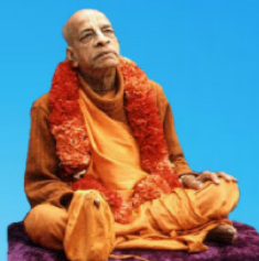
గురు భక్తవేదాంత ప్రభుపాద