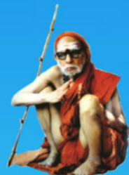
గురు చంద్రశేఖర పరమాచార్య