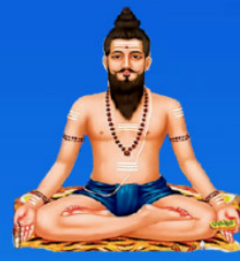
గురు విరభద్రాచార్య స్వామి