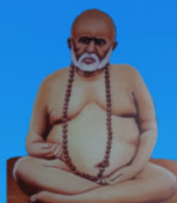
గురు వైలింగ్ స్వామి